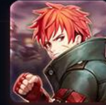
와일드 파이터 키우기