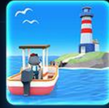
동물섬 어촌마을 타이쿤