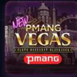
피망 뉴 베가스