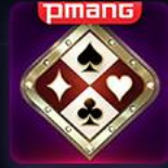
피망 포커 카지노 로얄